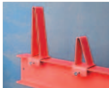
Rørstopp - Justerbar, finnes i to høyder (100, 200mm). Benyttes for lagring av runde rør med stor diame- ter. Erstatter høye endestoppere - gir flere lagringsnivåer.