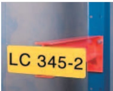
Merkeskilt - For merking av lagerplasser og gods.