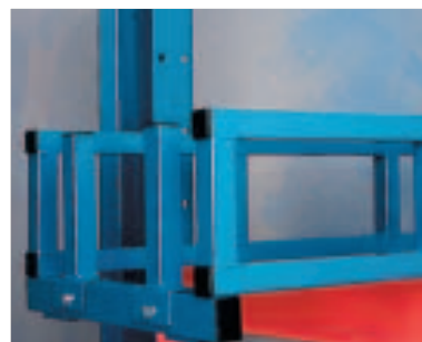
Materialkassett - For lagring og håndtering av langgods i kappede lengder. Justerbare avdelere, fasta hull.