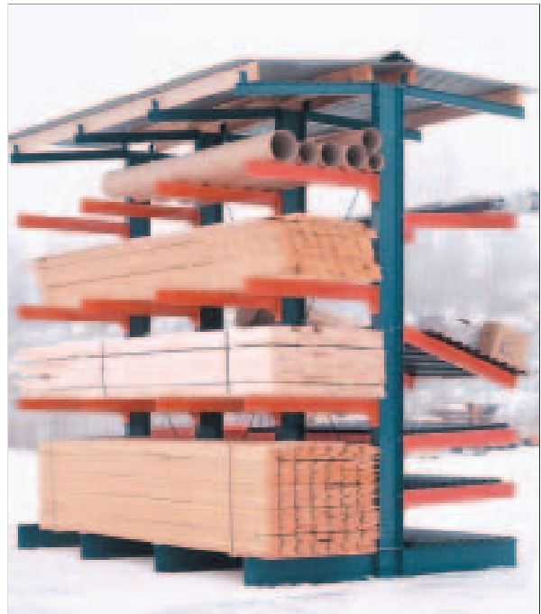
Grenreol med tak, for lagring av gods utendørs.