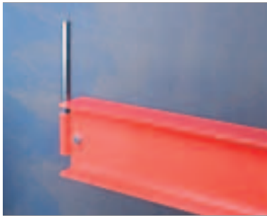
Endestopp - Standard, avtagbart, høyde 150 mm