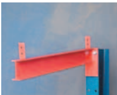
Takkonsoll - I skrudd utførelse. For montering av tak. Bøyning ned- over eller oppover.