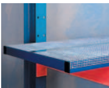
Hyller - For lagring av volumgods, finnes i ulike utførelser, f. eks. perforert plate (gitterutførelse).