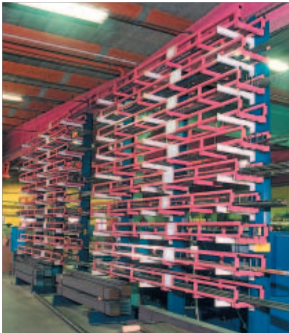
Lagring av langgoods i materialkassetter. Exte AB, Färila