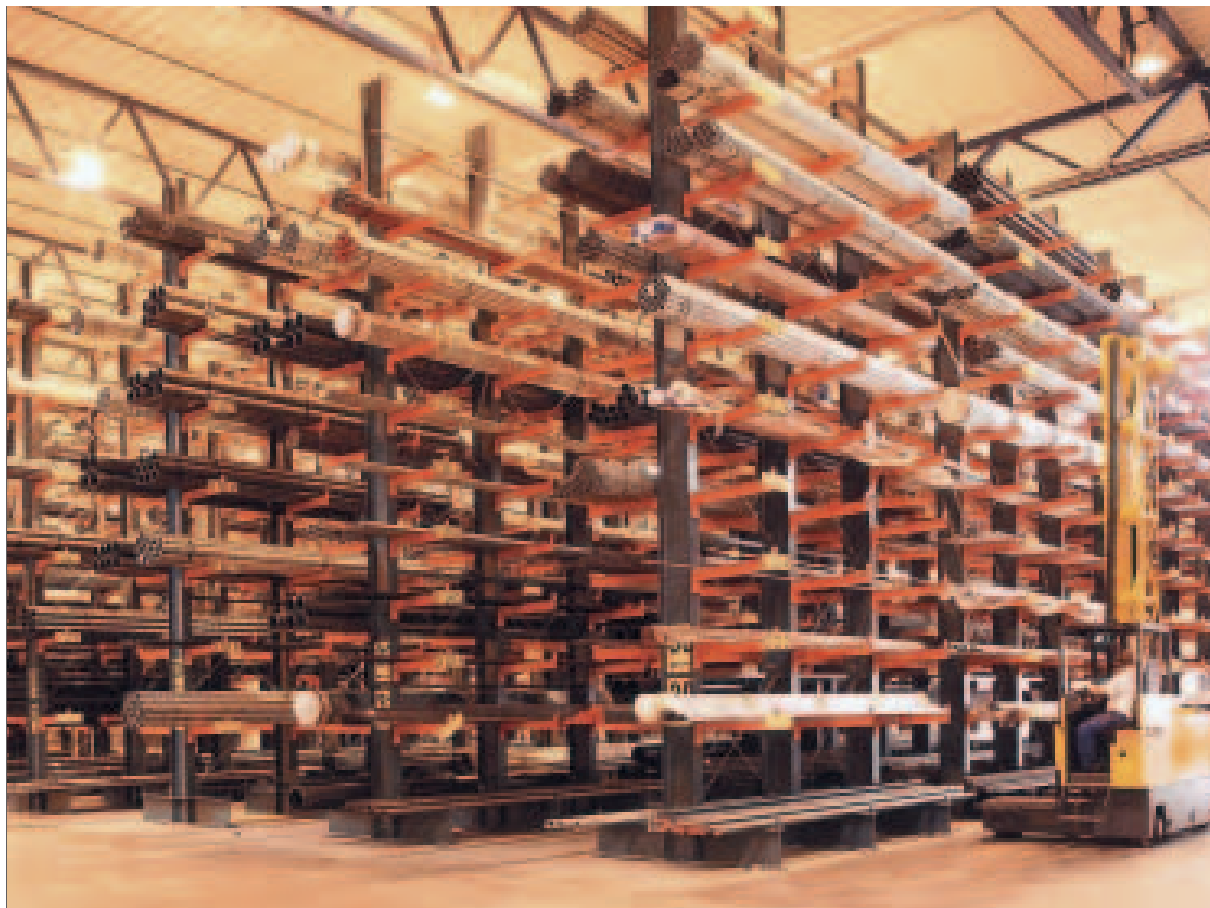
Lagring av rørgods.

Brødrene Dahl, sentrallager på Ski, Oslo