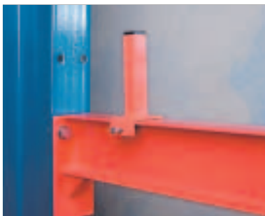
Avdelere - Justerbar, # 30x30, finnes i to høyder (150, 300mm). Benyttes for oppdeling av armen i flere rom.