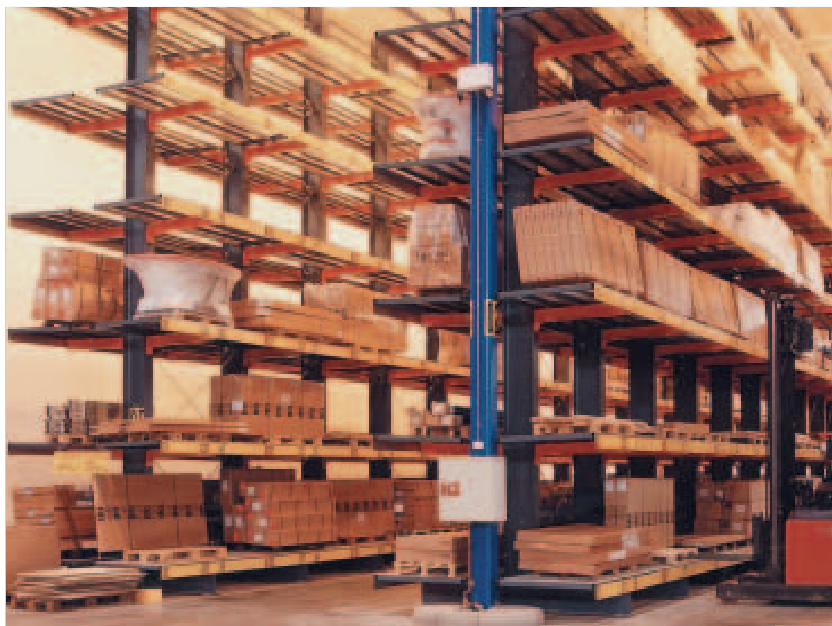
Lagring av volumgods.

Brødrene Dahl, sentrallager på Ski, Oslo