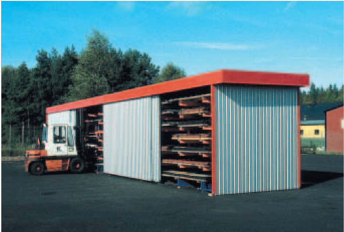
Lagring av byggplater i lagersystem der grenreoler utgjør bygningskroppen. SwedLandia Lagersystem AB, Ljungsbro