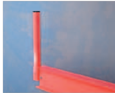
Endestopp - Kraftig utførelse, # 30x30, finnes i to høyder (150,300mm). Avtagbart med eller uten låsing.