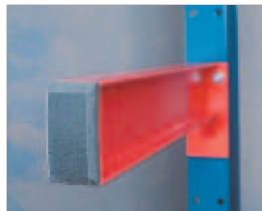
Endebeskyttelse - For beskyttelse mot armens skarpe ende. Benyttes ved manuell håndtering og plukking.